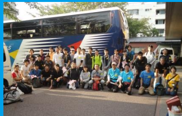
被災地へ行くボランティアが集結