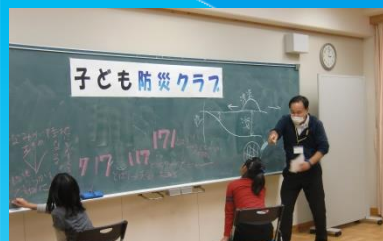
子どもたちと楽しく防災教育