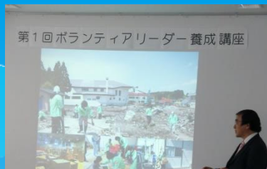
次世代の防災リーダーの育成