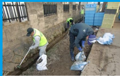
被災地の支援活動