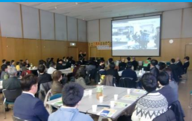
災害・防災講演会